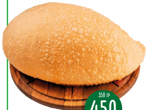
ЧЕБУРЕК XL С МЯСОМ